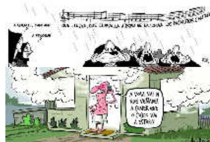
Las viñetas de FARO