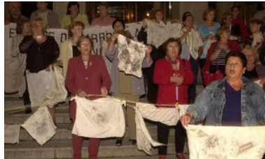
Un grupo de vecinas, con trapos sucios de carbón, en la entrada de la Autoridad Portuaria.

Este año la Medusa del muelle del Centenario cumplió un lustro. Desde su puesta en funcionamiento las protestas de los vecinos de Os Castros y A Gaiteira por las descargas disminuyeron, pero hace una década la plataforma anticarbón organizaba movilizaciones un día sí y otro también. Hubo un parón de ocho meses sin polvo de carbón, pero en septiembre de 2003 el problema volvió a acentuarse. El parque de San Diego apenas era frecuentado por niños. De hecho, los padres denunciaban que no se atrevían a darles allí la merienda porque en cuanto sacaban los yogures y la fruta se teñían de negro, del mismo color que estaban las ventanas de sus casas.