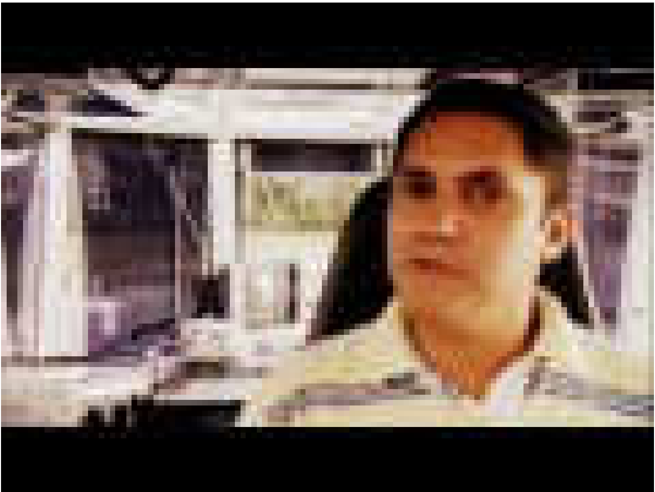
LA CONSTRUCCIÓN DEL CANAL DE PANAMÁ ( https://www.youtube.com/embed/H9IOZpEr1Pk )