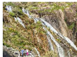
Diez cascadas que nos han calado Guía Repsol