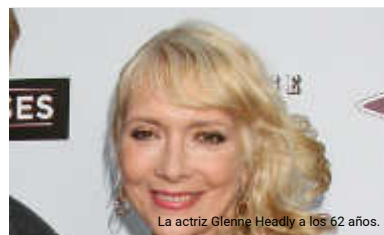
La actriz Glenn Headly a los 62 años.