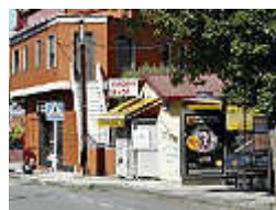
Un delincuente vigués ingresa