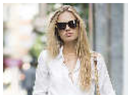
¿Por qué las mujeres llevan los botones de la camisa a la izquierda? Hola