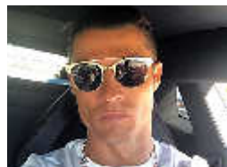
El súper lujoso coche que se compró Cristiano desafiomundial