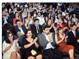
Acto de graduación de