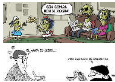
Las viñetas de FARO